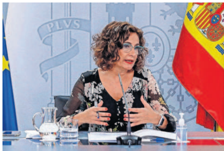
La ministra de Hacienda, María Jesús Montero.

El material sanitario esencial para afrontar la pandemia del coronavirus seguirá fiscalmente exento para los hospitales. Así lo decidió ayer el Consejo de Ministros al prorrogar hasta el 31 de octubre la norma impulsada en abril por la que las entregas, importaciones y adquisiciones intracomunitarias de este tipo de productos sanitarios dirigidos a entidades públicas, clínicas, centros hospitalarios o entidades sociales se gravan temporalmente a un tipo de IVA del 0%. La medida da cumplimiento a la extensión de este periodo de fiscalidad cero que ha impulsado la Comisión Europea y que el Gobierno trató de incorporar en el real decreto ley de reinversión de remanentes locales que el Congreso derogó.