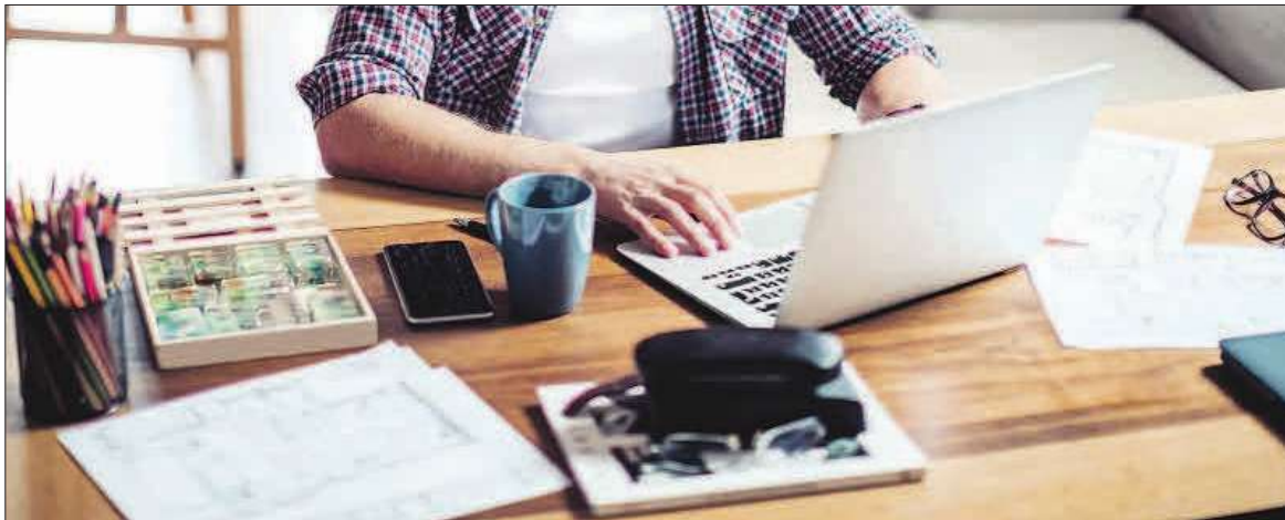
Un empleado trabaja telemáticamente.