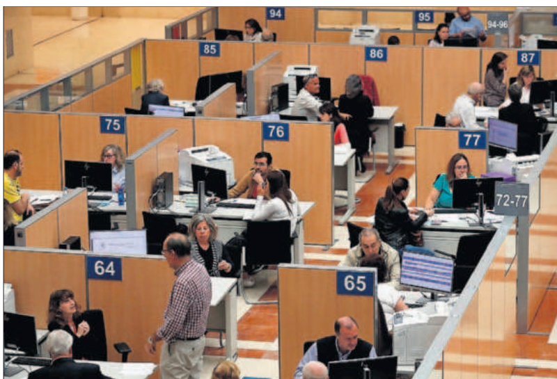
Instalaciones de la Agencia Tributaria en Madrid para atender a los ciudadanos, en 2018.