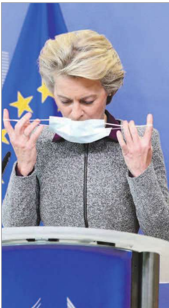
La presidenta de la Comisión Europea, Ursula von der Leyen.

Eso sí, en la carta enviada a las capitales, el Ejecutivo comunitario pide que los estímulos estén bien dirigidos, que sean temporales y su efectividad revisada regularmente. Podrían necesitar ser combinados con otras medidas más estructurales para mejorar las economías, incluida su sostenibilidad o dimensión digital, o para tener un impacto positivo en la demanda.