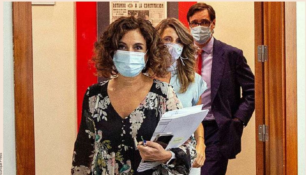
La ministra de Hacienda y portavoz, María Jesús Montero; la ministra de Trabajo, Yolanda Díaz, y el ministro de Sanidad, Salvador Illa, ayer.

Tras establecer en la aplicación de la norma que las empresas deberían revisar contratos y asumir los costes asociados desde la entrada en vigor de la ley, la patronal ha arrancado al Gobierno que no habrá que cambiar contratos durante la pandemia, pero sí asumir los costes desde la entrada en vigor de la norma, a los 20 días de su publicación en el BOE, esto es, el 13 de octubre, en un momento en el