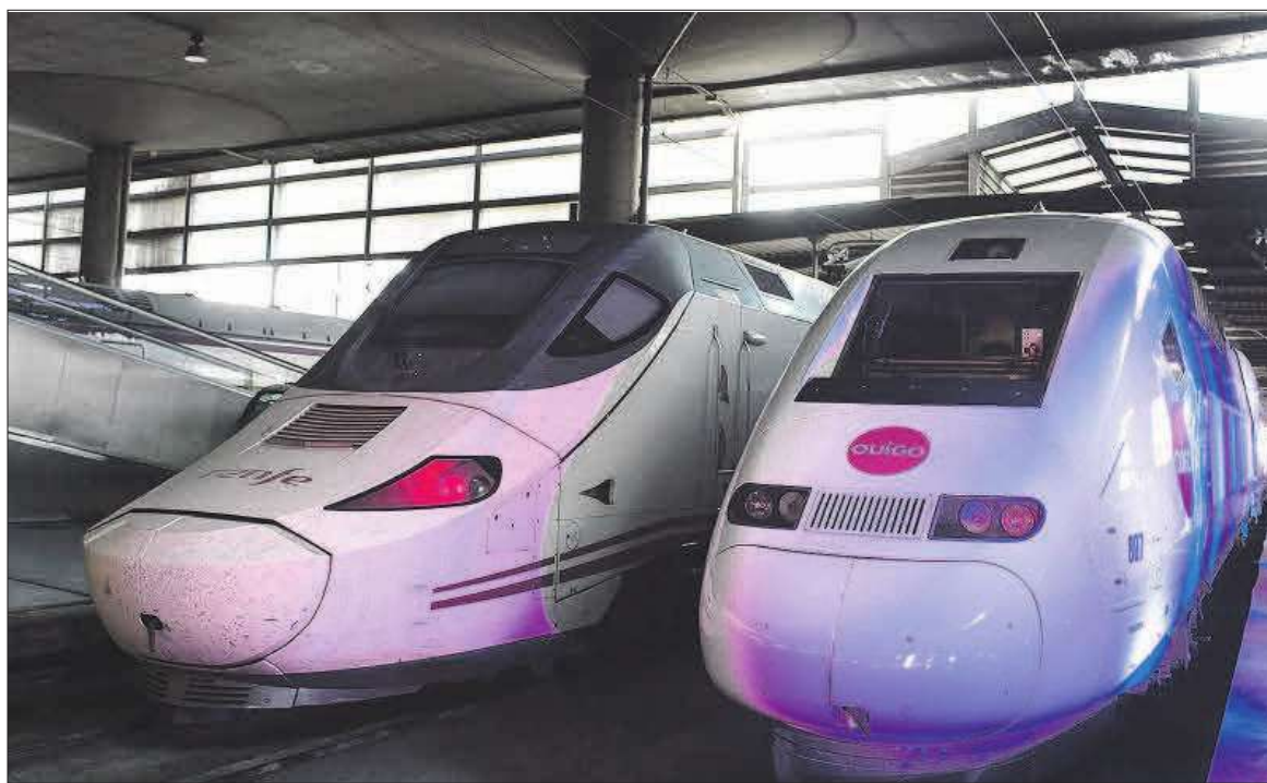
Un OUIGO de SNCF y un AVE de Renfe aparcados en Atocha.