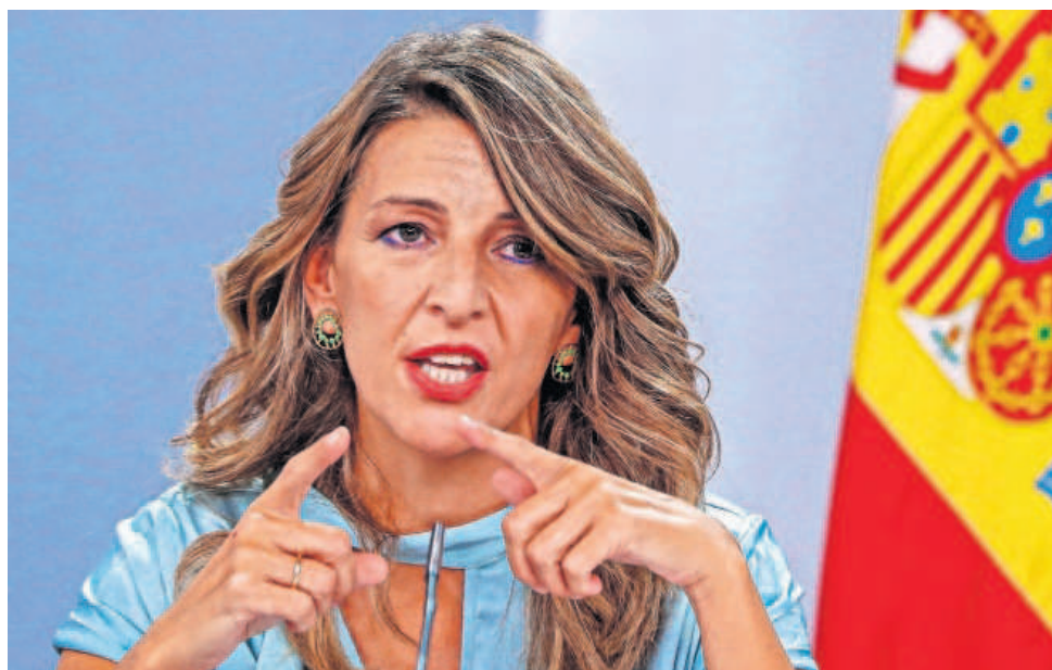
La ministra de Trabajo, Yolanda Díaz, en la rueda de prensa posterior al Consejo de Ministros.

Según esta diferenciación entre la clara y nítida obligación empresarial de