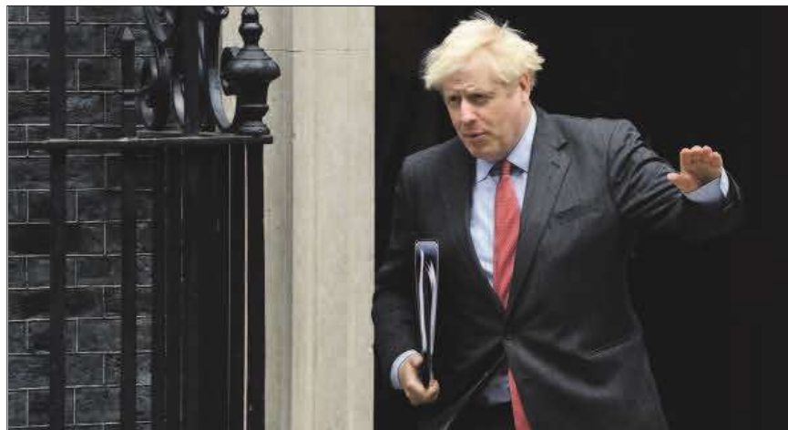
El primer ministro de Reino Unido, Boris Johnson.

En el caso del Reino Unido, los servicios de Economía de la Comisión han decidido que no aplicarán