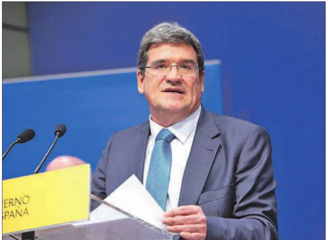
El ministro de Inclusión, Seguridad Social y Migraciones, José Luis Escrivá. ALBERTO MARTÍN

aspecto del reglamento del ingreso mínimo vital. Entre otras medidas destinadas a facilitar la petición de esta prestación está la de la extensión del plazo de retroactividad en